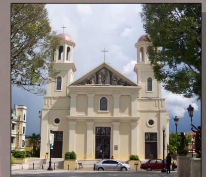
Ilustración 1C- Catedral de Mayagüez, 2002. Estilo Ecléctico