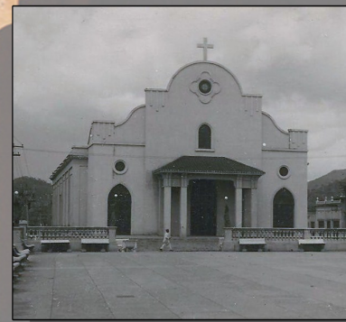
Ilustración 1B- Catedral de Mayagüez, 1922. Estilo Art Deco